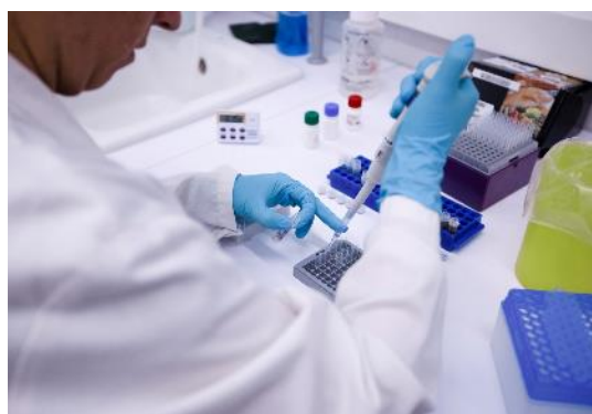
04. Centro de innovación