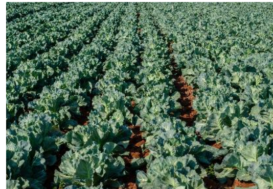
02. Punto de conexión entre el mundo rural y el urbano