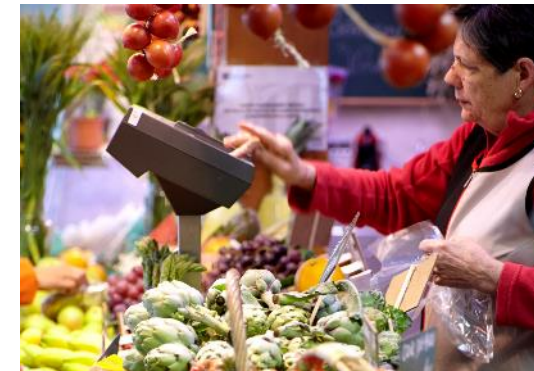
03. Dinamizador del comercio y la restauración locales