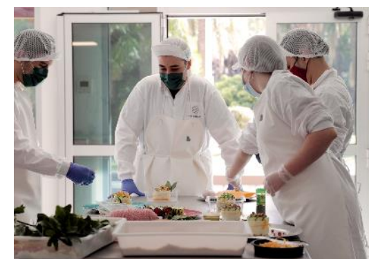
06. Campus de formación alimentaria