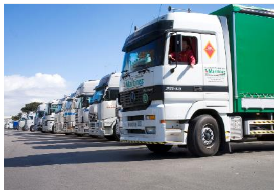
01. Polo empresarial y logístico

DE MERCADO MAYORISTA A ECOSISTEMA AGROALIMENTARIO