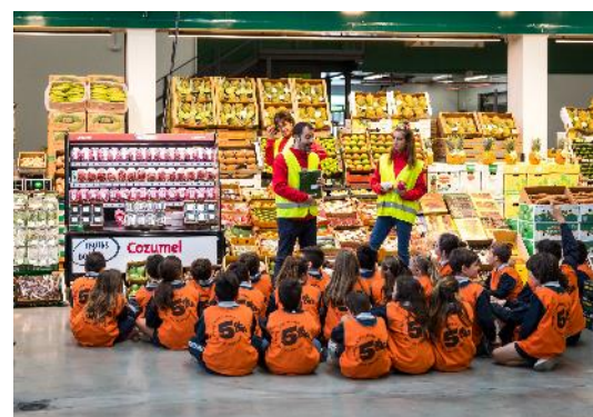
05. Fomento de la alimentación saludable