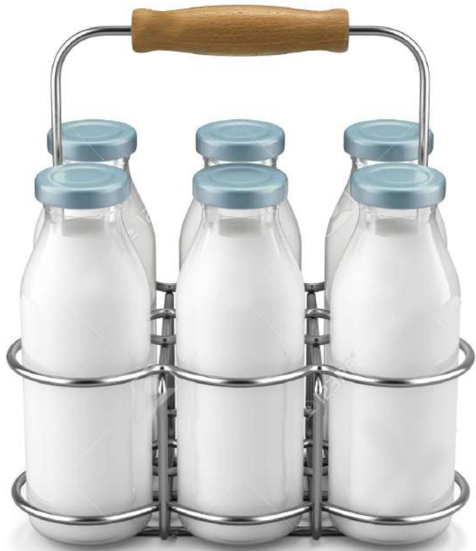
“The milkman 4.0”

Aprendamos del pasado para reinventar el futuro.